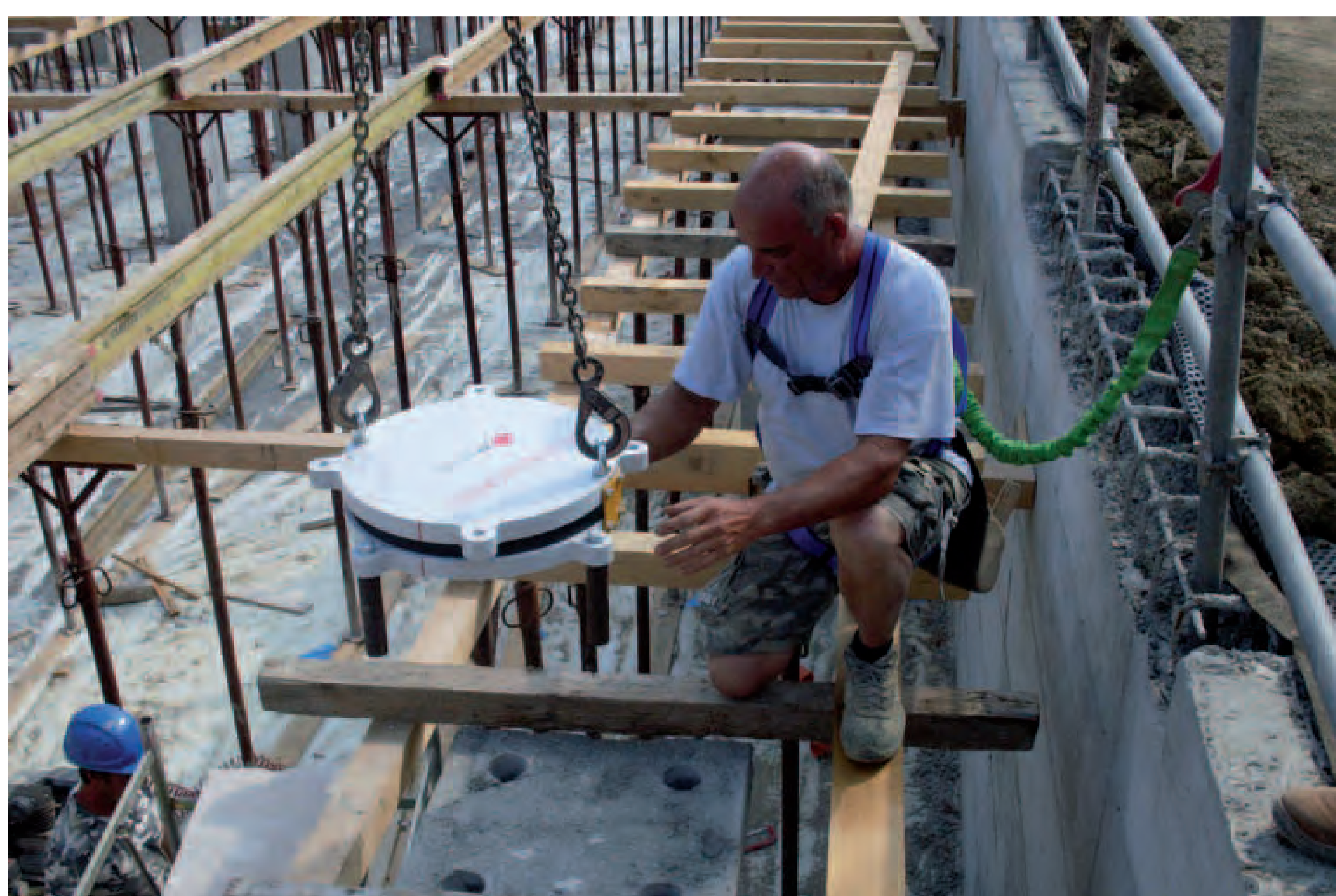
In alto da sinistra: - l'armatura del capitello, il pilastro con le sedi di alloggiamento, la movimentazione e l'inserimento della piastra