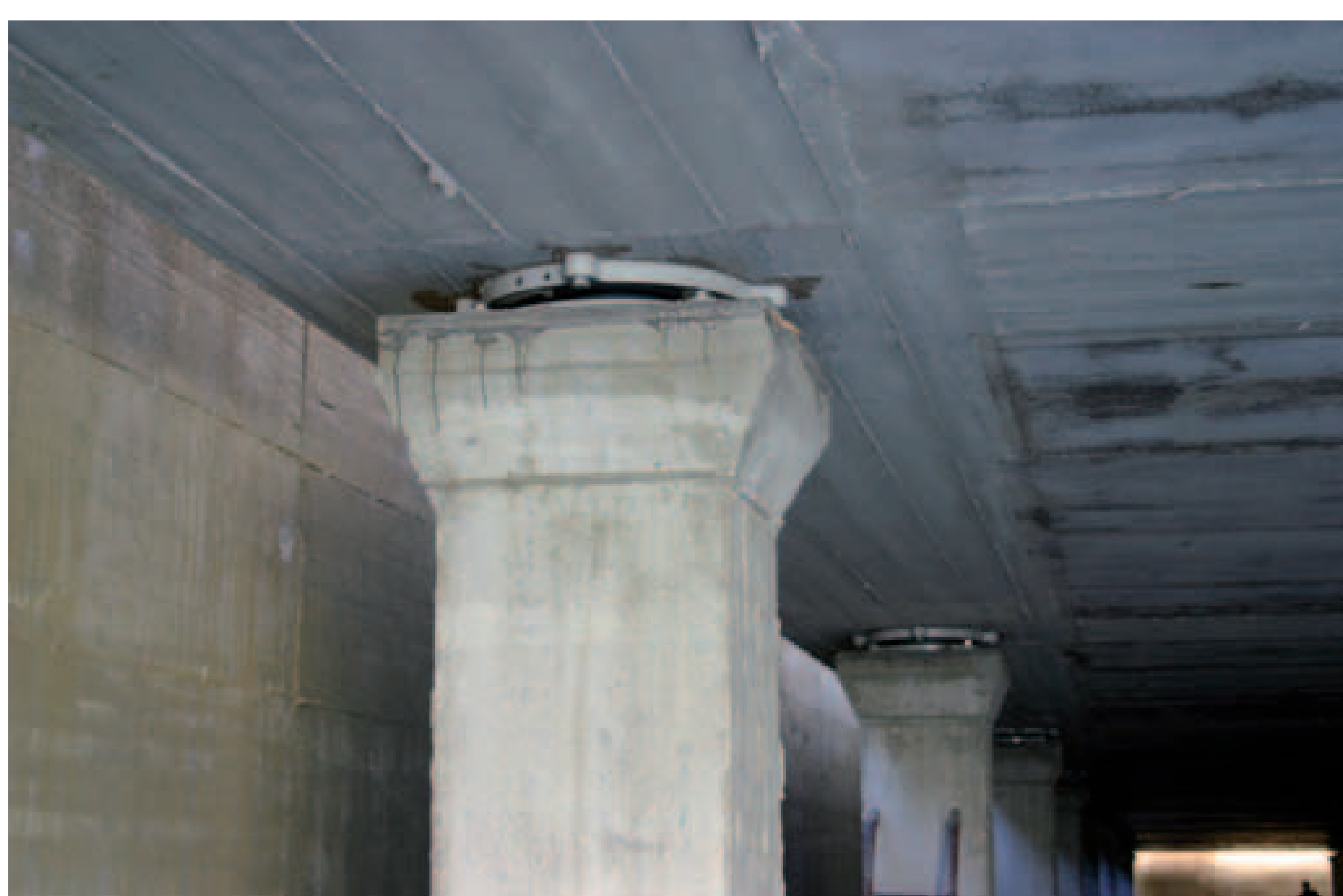
Sopra e a destra: montaggio delle lastre del solaio; realizzazione del cassero "a misura"; posa in opera delle armature; vista dell'appoggio nei locali interrati, una volta rimossi i fermi